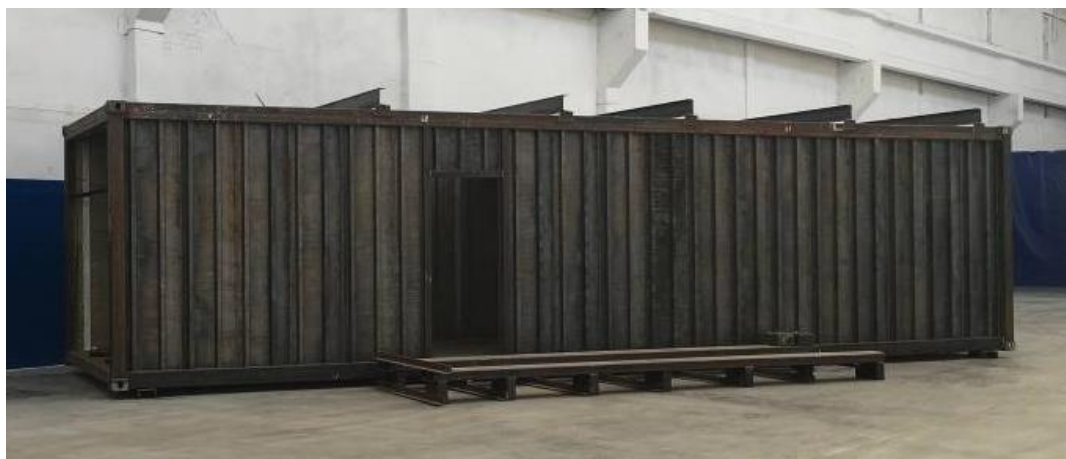
Рисунок 5.1 - Цельнометаллический контейнер

Внешний вид контейнера представлен на рисунке 5.1.