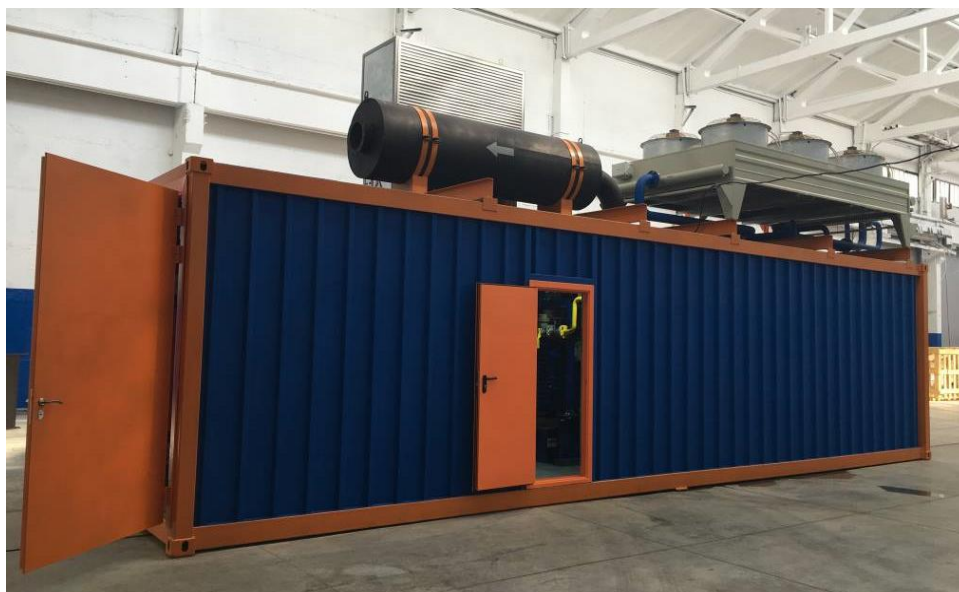
Рисунок 5.2 - Газо-поршневая электростанция ITE 1500 G (пример)

Функционально завершенная газопоршневая электростанция ITE 1500 G представлена на рисунке 5.2.