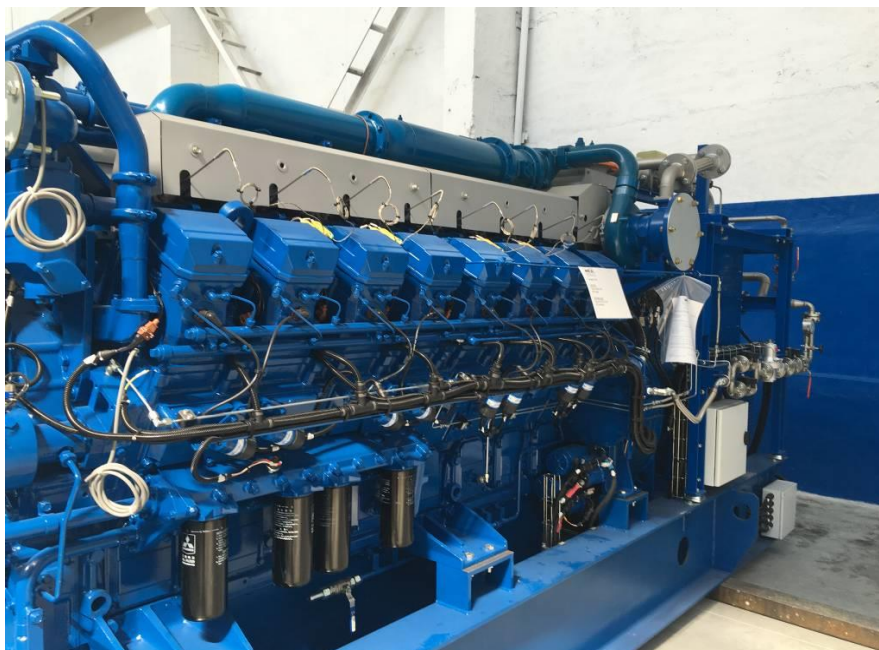
Рисунок 5.3 – Газо-поршневой двигатель Mitsubishi GS16R2-PTK