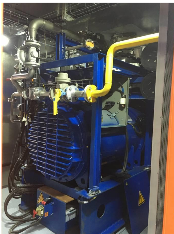
Рисунок 5.4 - Узел подвода природного газа к двигателю